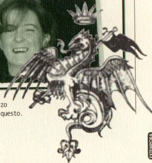
Carnevale ogni scherzo vale, dice un vecchio proverbio. Le donne del Drago sanno stare allo scherzo (non sempre tutte, a dire il vero) e sanno prendere la vita con filosofia. Sono uniche anche per questo.