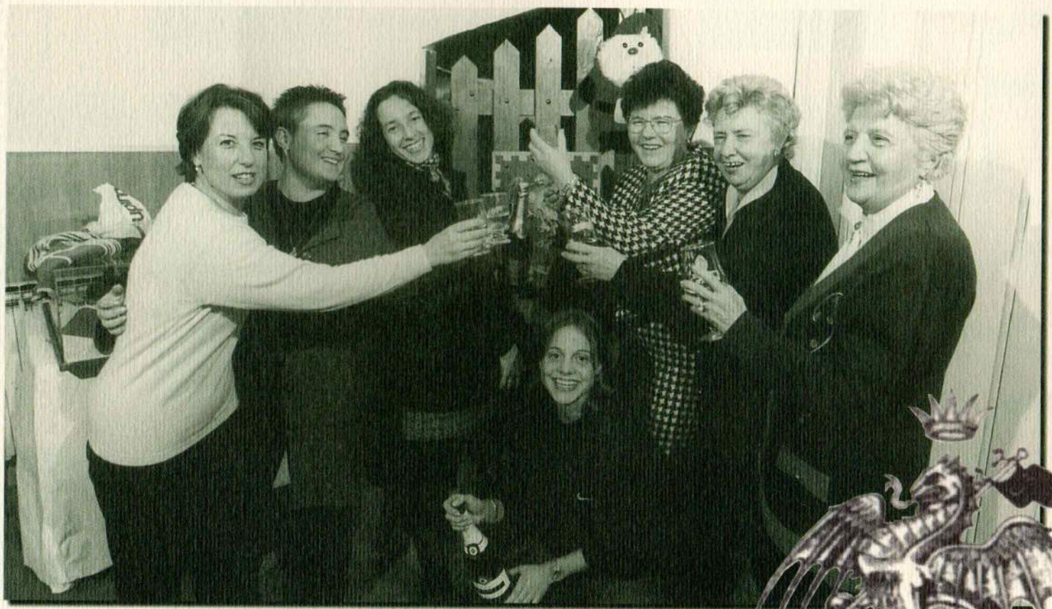
Le Dragaiole del Duemila ci hanno accompagnato per un anno intero. Il viaggio continua!